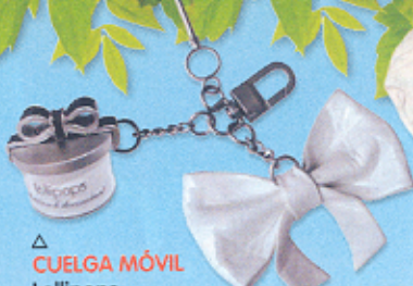
△ CUELGA MÓVIL Lollipops