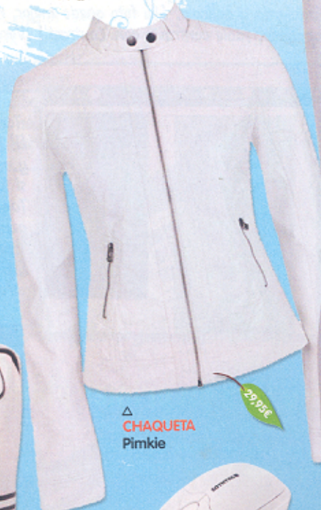
△ CHAQUETA Pimkie