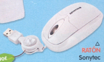
▷ RATÓN Sonytec