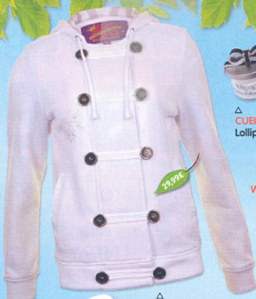
△ CHAQUETA Jennyfer