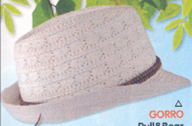
△ GORRO Pull&Bear