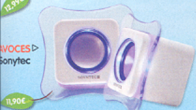
AVOCES ▷ Sonytec