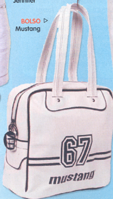
▷ BOLSO Mustang