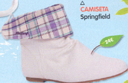
△ BOTINES Mustang