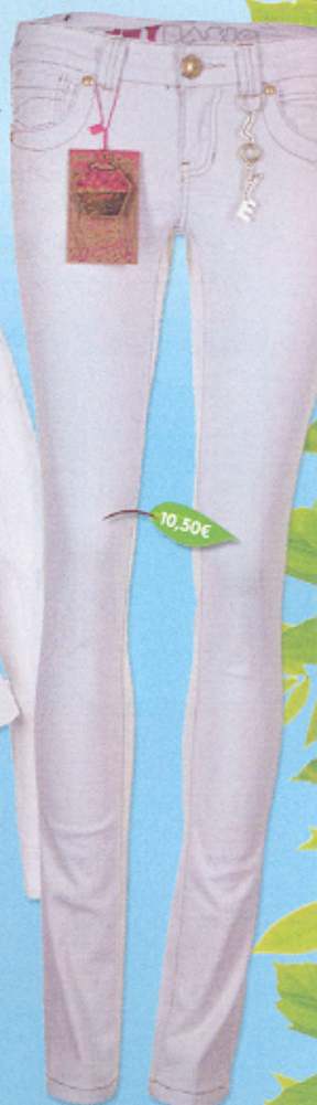
▷ PANTALONES Bijou Brigitte